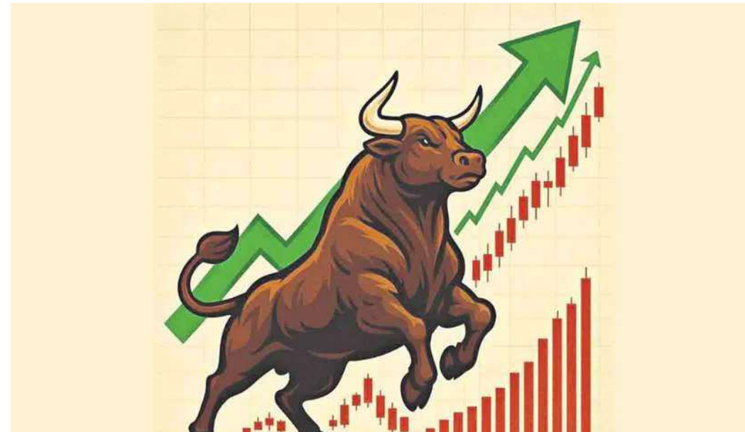
ఖరారవుతుందని ఆశిస్తున్నామని యూఎస్ విదేశాంగ మంత్రి విలువ కూడా 35 పైనల మేర కోలుకుంది. ప్రస్తుతం రూపీ మార్కెట్ రూబియో వెల్లడించడం కూడా మార్కెట్లకు జోషును వాల్యూ 95.25 వద్ద స్థిరపడింది. ఇచ్చింది. ఈ క్రమంలో దాలర్తో పోలిస్తే రూపాయి మారకం

దేశీయ స్టాక్ మార్కెట్లు సోమవారం భారీ లాభాల్లో ముగిశాయి. పశ్చిమాసియాలో యుద్ధ మేఘాలు తొలగిపోతాయనే అంచనాల మధ్య సూచీలు లాభాల్లో కదలాడాయి. దాంతో బాంబే స్టాక్ ఎక్స్చేంజ్ సూచీ సెన్సెక్స్ 1100 పాయింట్ల వరకు పెరిగింది. సెన్సెక్స్ నేటి ట్రేడింగ్లో 76,135 వద్ద మొదలైంది. చివరకు 1,073 పాయింట్ల లాభంతో 76,488 వద్ద ముగిసింది. నిష్ఠీ 312 పాయింట్లు ఎగబాకి, 24 వేల పైన స్థిరపడింది. నిష్ఠీ సూచీలో ఐఐఐఐ మోటార్స్, అదానీ ఎంటర్ప్రైజెస్, బజాజ్ ఫైనాన్స్, టీఎంపీఐ, లార్జెన్ షేర్లు రాణించాయి. మ్యూక్స్ హెల్త్కేర్, ఓఎన్జీసీ, హిందాల్కో, నెస్లే, బజాజ్ ఆటో స్టాక్స్ సప్లయ్ యాయి. యుద్ధం ముగించే విషయమై అమెరికా -- ఇరాన్ మధ్య శాంతి చర్చలు ఓ కొలిక్కి వస్తున్నాయనే వార్తలతో అంతర్జాతీయ మార్కెట్లో ముడి చమురు ధరలు కాస్త దిగిచ్చాయి. ఒక బ్యారెల్ క్రూడ్ ఆయిల్ ధర 5.58 శాతం తగ్గి, 97.76 దాలర్లకు వచ్చింది. చమురు ధరలు తగ్గడంతో బ్యాంక్ షేర్లు పెరిగాయి. ఆయిల్ ధరల తగ్గుదల కారణంగా ద్రవ్యోల్బణం అదుపులో ఉంటుందని, వడ్డీ రేట్లలో స్థిరత్వం వస్తుందని మదుపర్లు భావిస్తున్నారు. అంతర్జాతీయ మార్కెట్లలోని సానుకూల సంతకాలు కూడా నేటి లాభాలకు ఓ కారణంగా చెప్పవచ్చు. అమెరికా-భారత్ మధ్య చాలా కాలంగా పెండింగ్లో ఉన్న వాణిజ్య ఒప్పందం త్వరలోనే