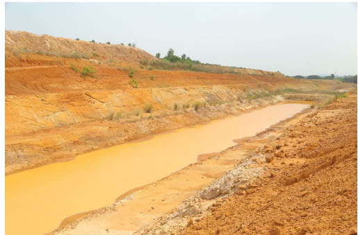
రాష్ట్ర వ్యవసాయ శాఖ మంత్రివర్గం తుమ్మల నాగేశ్వర రావు పచ్చి పర్వతాలానికే బేతుపల్లి చెరువుకు గోదావరి జలాలు చేరాల్సి దీప్తిబాబులకి కాలువల భూసేకరణలో రైతులు, ప్రజాప్రతినిధులు సహకరించాలి యాత్రాలకుంట