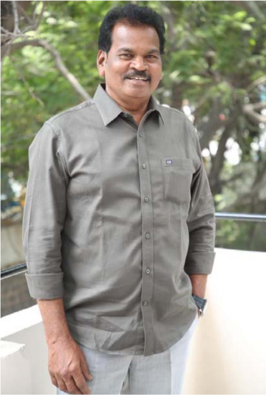
డాఖలాలు లేవు. ఈ ప్రయాణం నాకెంతో సాఫీగా సాగినట్లు అనిపించింది. బయట చెప్పినట్లుగా ఇండస్ట్రీలో చెడు వాతావరణం నాకు కనిపించలేదు. నెక్స్ట్ ప్రాజెక్టుల గురించి చెప్పండి? మా అబ్బాయికి నేను ముందుగానే మాట ఇచ్చాను. మూడు సినిమాలు చేస్తానని చెప్పానని. అప్పటి వరకు మా వాడు నిరూపించుకుని హీరోగా నిలబడితే ఓకే. లేదంటే మళ్లీ మా ఊరికి వచ్చి వ్యవసాయం చేయాలని ముందే చెప్పాను. అలా నేను మా వాడితో కచ్చితంగా నాకున్న స్టోమతలో మూడు సినిమాలు అయితే చేస్తాను.