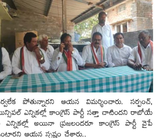
ఓర్వలేక పోతున్నారని ఆయన విమర్శించారు. సర్పంచ్, మున్సిపల్ ఎన్నికల్లో కాంగ్రెస్ పార్టీ సత్తా చాదించిన రాబోయే ఏ ఎన్నికల్లో ఆయన ప్రజలందరూ కాంగ్రెస్ పార్టీ వైపే ఉంటారని ఆయన స్పష్టం చేశారు..