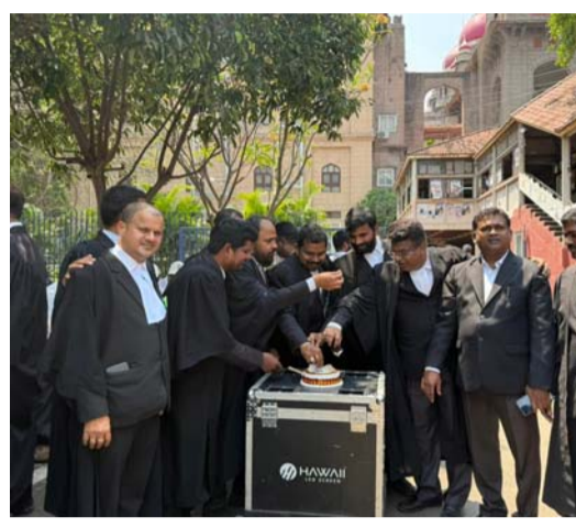
ద్వారానే న్యాయవ్యవస్థ మరింత బలోపేతం అవుతుందని అన్నారు. ఒక వైపు బాధ్యతాయుతంగా ఓటు హక్కును మరో వైపు సాధించిన విజయాలను సందరంగా జరుపుకోవడం ద్వారా న్యాయవాదుల ఆత్మవిశ్వాసం మరియు బక్కత మరింత పెరుగుతుందని స్పష్టం చేశారు.