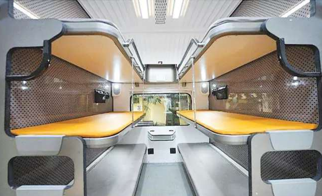
రైల్లో 823 మంది ప్రయాణించవచ్చు. గంటకు 180 కి.మీ. గరిష్ట వేగంతో వెళ్లేందుకు వీలుగా రైలును

సుదూర ప్రయాణాలు చేసే ప్రయాణికులకు వందేభారత్ స్టీపర్ రైళ్లు త్వరలోనే అందుబాటులోకి రానున్నాయి. దీనిపై రైల్వేశాఖ మంత్రి అశ్వినీ వైష్ణవ్ గురువారం ప్రకటన చేశారు. తొలి రైలు కోల్కతా-గువాహాటిల మధ్య అందుబాటులోకి రానుందని తెలిపారు. ఈ రైలు ఈ నెల 18 లేదా 19న ప్రధాని నరేంద్ర మోదీ చేతుల మీదుగా ప్రారంభమవుతుందన్నారు. పశ్చిమబెంగాల్-అస్సాం మధ్య నడిచే ఈ రైల్లోని టికెట్ ధరలు.. విమాన టికెట్ల కంటే తక్కువే ఉంటాయన్నారు. ప్రస్తుతం ఈ రెండు నగరాల మధ్య విమాన ప్రయాణానికి రూ.6 వేలు నుంచి రూ.8 వేలు ఖర్చవుతోందని వైష్ణవ్ తెలిపారు. వందేభారత్ స్టీపర్ లో థర్డ్ ఏసీలో టికెట్ ధర (ఆహారంతో కలిపి) సుమారు రూ.2,300, సెకెండ్ ఏసీలో సుమారు రూ.3 వేలు, ఏసీ ప్రథమ శ్రేణిలో సుమారు రూ.3,600 ఉంటుందన్నారు. మధ్య తరగతిని దృష్టిలో పెట్టుకొని టికెట్ ధరలు నిర్ణయించినట్లు చెప్పారు. ఆరు నెలల్లో మరో ఎనిమిది రైళ్లు సిద్ధమవుతాయని, ఈ ఏడాదిలో మొత్తం 12 రైళ్లు అందుబాటులోకి వస్తాయని తెలిపారు. 11 థర్డ్ ఏసీ, నాలుగు సెకెండ్ ఏసీ, ఒక ఫస్ట్ ఏసీ పెట్టెలుండే ఈ