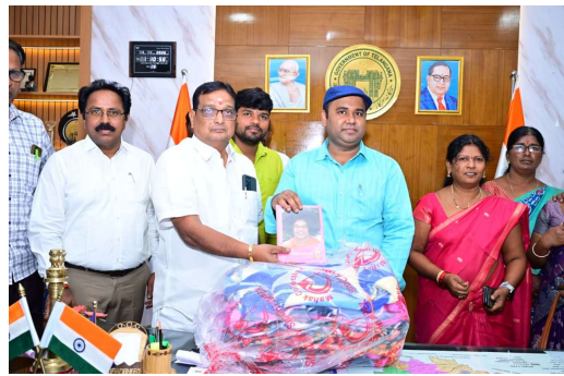
అధికారులు పనిచేసి... ప్రభుత్వ పథకాల ఫలాలు చివరి గడపకు చేరేలా చూడాలన్నారు. నూతన సంవత్సరం అందరికీ కొత్త ఆశలు, నూతన ఉత్సాహం, మరిన్ని విజయాలను అందించాలని కలెక్టర్ తన సంవేదంలో పేర్కొన్నారు.

జిల్లాగా నిలవాలన్నారు. జిల్లా అభివృద్ధిలో భాగంగా 2025 సంవత్సరంలో సాధించిన పురోగతి, మిగిల్చిన మధురస్మృతులు మరియు విజయాలను ఈ సందర్భంగా గుర్తుచేసుకుంటూ, వాటి సాధన కోసం అంకితభావంతో కృషి చేసిన అధికారులు, ఉద్యోగులు, ప్రజాప్రతినిధులు, ప్రజలందరికీ కలెక్టర్ హృదయపూర్వక ధన్యవాదాలు తెలిపారు. కొత్త సంవత్సరం 2026 జిల్లావాసులందరికీ సుఖసంతోషాలు, ఆరోగ్యం, శ్రేయస్సు తీసుకురావాలని ఆకాంక్షించారు. అలాగే ప్రజలు చేపట్టిన ప్రతి కార్యం నిర్విఘ్నంగా విజయవంతం కావాలని, సమష్టి కృషితో మెదక్ జిల్లా అభివృద్ధిలో మరిన్ని మైలురాళ్లు అధిరోపించి, రాష్ట్రస్థాయిలో ఆదర్శ జిల్లాగా నిలవాలని కలెక్టర్ ఆకాంక్షించారు. జిల్లా అధికారులకు కలెక్టర్ శుభాకాంక్షలు తెలిపారు. కొత్త సంవత్సరం మరింత ఉత్సాహంతో