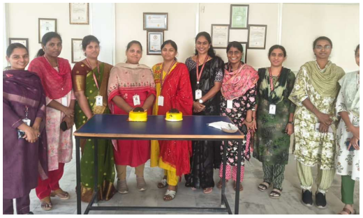
ఇలాంటి విజయాలను సాధించడంలో ఈ గుర్తింపు సంస్థకు మరింత ప్రేరణనిచ్చే పరిపాలనా బలం అవుతుందని అభిప్రాయపడింది. కేజీఆర్ ఐటీఎమ్ విద్యా తపన, నిబద్ధత, నైపుణ్యానికి ఈ విజయాల నిలువెత్తు నిదర్శనాలు.