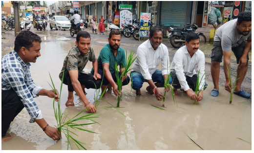
వాళ్లు నడుస్తుంటే జారిపడ్డ జారిపడిన రోజులు కూడా చాలా ఉన్నాయి ఒక చిన్నపాటి వర్షానికి చిత్తడిగా మారిన ఈ రోడ్డు అతిపెద్ద వర్షం పడితే చెప్పలేని పరిస్థితిగా ఏర్పడుతుందని వార్డ్ ప్రజలు వాపోతున్నారు.

నిత్యం వాహనాలు ప్రయాణిస్తుంటాయి దీనికి తోడు ఈ రోడ్డుపై అంబులెన్స్ వాహనాలు కూడా ప్రయాణిస్తుంటాయి నిలుపుతూ ట్రాఫిక్కు అంతరాయం కలిగిస్తున్నారో రోడ్డుపై కంకర అధికంగా తేలి ఉండటం వల్ల ప్రయాణికులకు తప్పని తిప్పలు గా మారింది ఇక్కడైనా అధికారులు స్పందించి ఈ కాలనీలో మోర్లు చేసే ప్రజలకు ఇబ్బందులు కలవకుండా చూడాలని కాలనీవాసులు కోరుతున్నారు చాలాసార్లు అధికారులకు మొరపెట్టుకున్నా గాని వారు తూతూ మంత్రంగా వాటిని సరిచేసి వెళ్లడం జరిగింది యదా రాజా తథా ప్రజా అన్నట్లు మట్టి వర్షం పడితే నీళ్లు అలాగే ఉండి వచ్చి పోయే వాళ్లకు అశోకరంగా ఉండడం మూలంగా ఈరోజు అనివాసులు వరి నాట్లు వేసి వాళ్లు నిరసన తెలియజేశారు ఈ దారిలోనే ప్రచవతికి వచ్చిన గర్భిణీలు