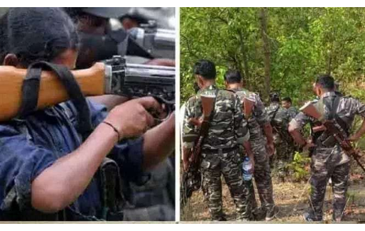
ఎదురుకాల్పులు ఇంకా కొనసాగుతుండగా.. మృతుల సంఖ్య పెరిగి ఆస్పత్రం ఉన్నట్లు సమాచారం. ఆపరేషన్ కగర్ లో భాగంగా ఇప్పటికే అనేక మంది మావోయిస్టులు ఎన్కౌంటర్లో మరణించారు.

ఖమ్మం జిల్లా ప్రతినిధి అక్షర రేఖ:స్యూస్ జూలై 18 భద్రతా బలగాలు, మావోయిస్టుల మధ్య ఎదురు కాల్పులతో అబుజ్ మెడ్ అటవీ ప్రాంతం దగ్గరైంది. నారాయణపూర్ లో భద్రతా బలగాలు కూచింగ్ నిర్వహిస్తున్న సమయంలో మావోయిస్టులు ఎదురు పడటంతో ఇరువర్గాల మధ్య కాల్పులు జరిగాయి. శుక్రవారం మధ్యాహ్నం నుంచి జరుగుతున్న ఈ కాల్పుల్లో ఆరుగురు మావోయిస్టులు మరణించినట్లు తెలుస్తోంది. ఆరుగురి మృతదేహాలతో పాటు.. రైఫిల్స్, పేలుడు పదార్థాలు, ఆయుధాలను స్వాధీనం చేసుకున్నట్లు సీనియర్ పోలీస్ అధికారి ఒకరు వెల్లడించారు. కాగా.. ఎన్కౌంటర్లో హతమైన మావోయిస్టుల వివరాలు ఇంకా వెల్లడించలేదు. ఆపరేషన్ ముగిసిన అనంతరం పూర్తి వివరాలు వెల్లడిస్తామని తెలిపారు.