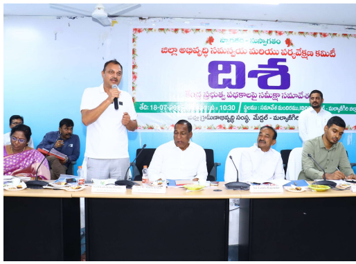
చేశారు. ఈ కార్యక్రమంలో అయా శాఖల అధికారులు తదితరులు పాల్గొన్నారు.